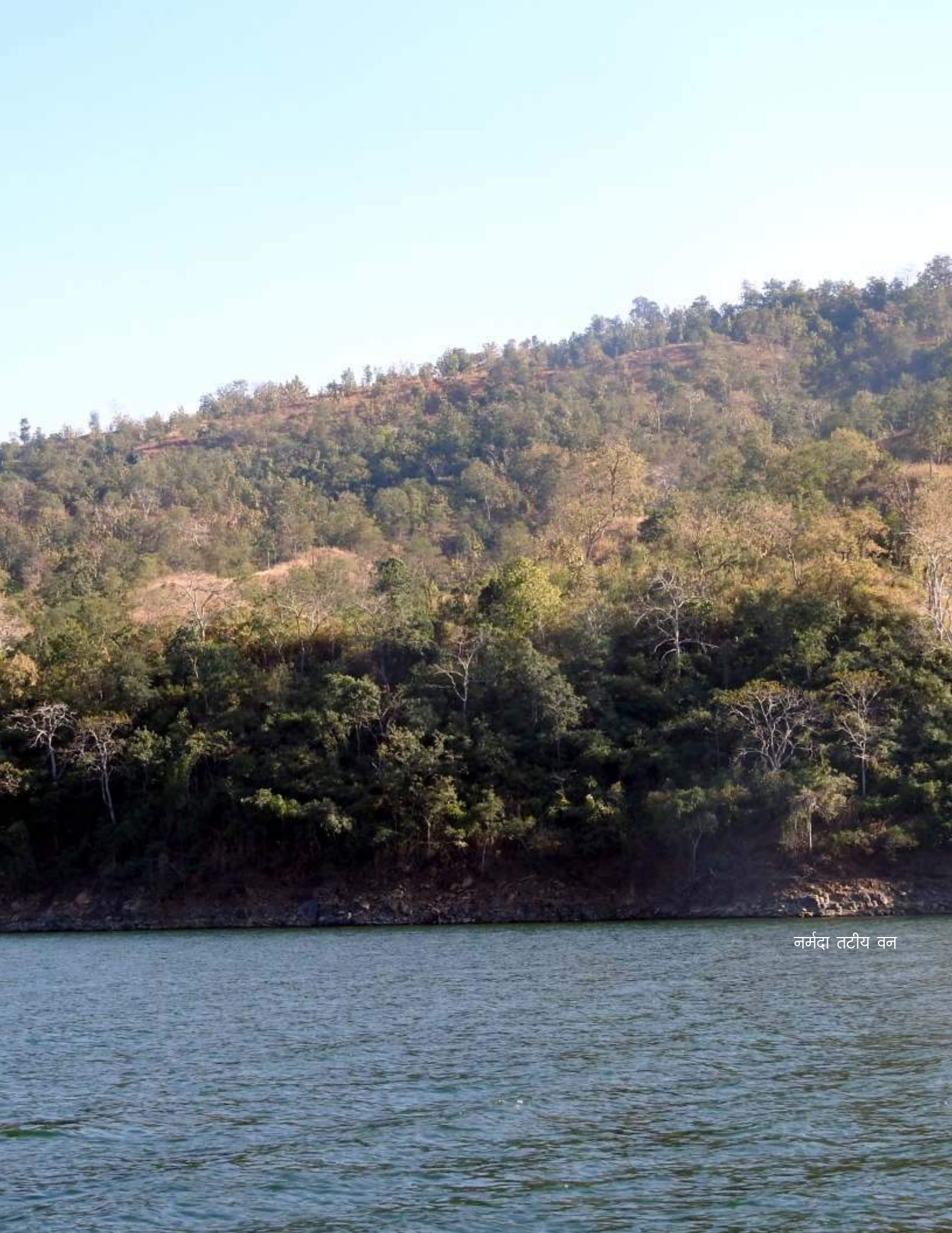
नर्मदा तटीय वन